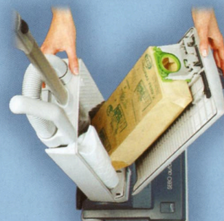
Facile sostituzione del sacchetto filtro