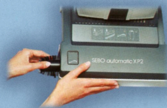
Pratica sostituzione dello spazzolino